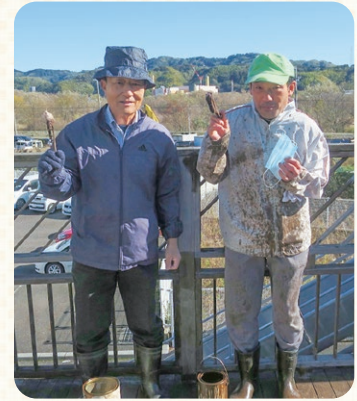
都田さん(左)と土田さん(右)